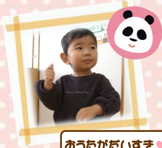
おうたがだいすき♡