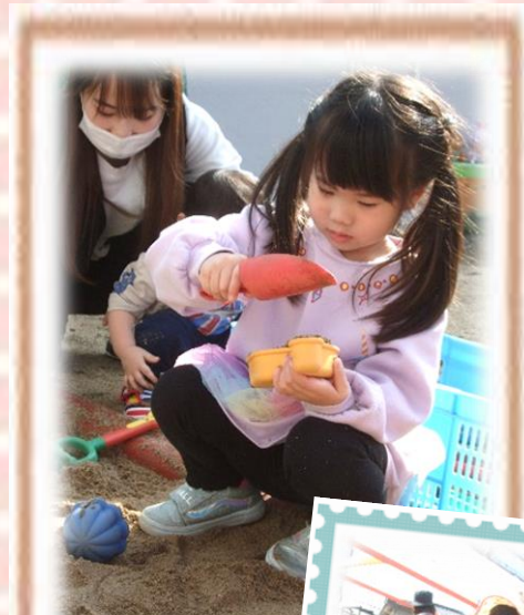
おともだちといっしょ