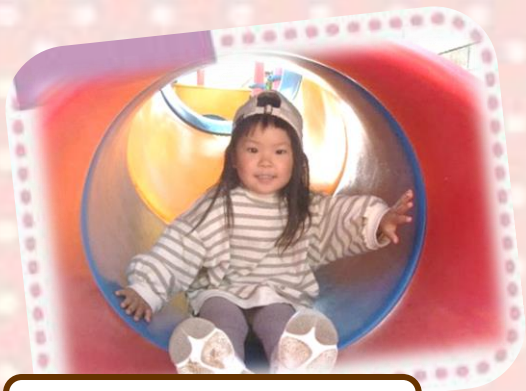
おみきもちいいね!

第二園庭ですべり台やブランコ、お砂場で遊んだよ。ざらざら、ギュッギュ、ひんや〜いの砂の感触はどうだったかな?おひさまがぽかぽかとあたたかくて、とっても心地よかったね!