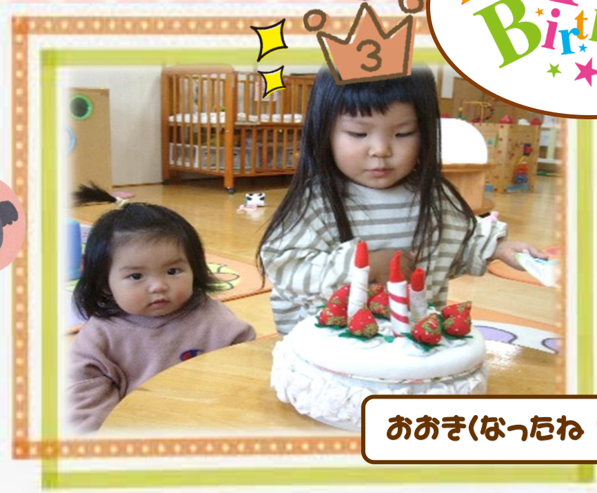
おおきくなったね!